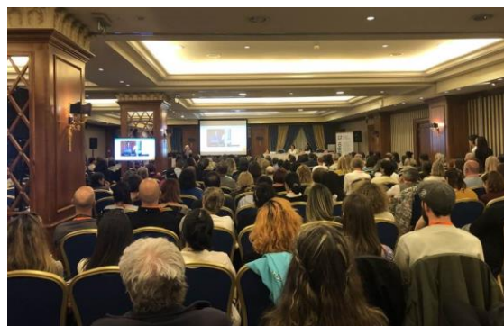
Öppningsceremonin på Royal Olympic Hotel, Athen

Vi fick även tillfälle att utforska Athens gamla stad Plaka samt besöka Akropolis. Det var mäktigt att vara i denna historiska miljö, rötterna till den västerländska civilisationen, och samtidigt reflektera kring hur det är att vara människa i och leva i den moderna världen. Det jag bär med mig, förutom de intressanta föreläsningarna, är alla fina möten med kollegor runt om i världen och en stark känsla av gemenskap kring det existentiella synsättet. Nästa konferens, den fjärde i ordningen, kommer att äga rum i Denver 2026.